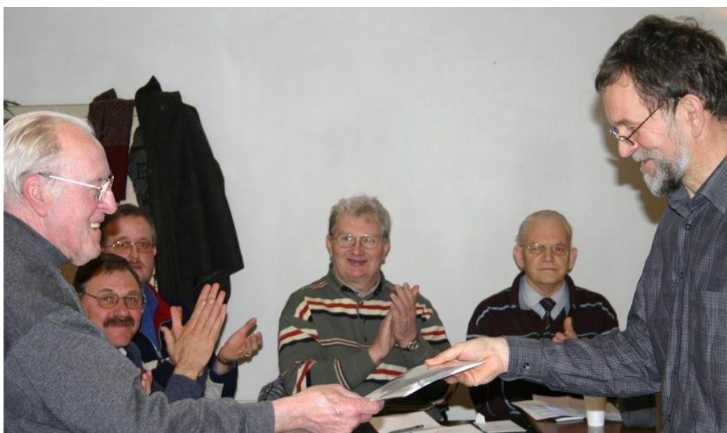
Uitreiking van gewonnen prijzen

Het zien van onze dieren op tentoonstellingen is ook belangrijk voor de liefhebbers van onze rassen. Liefhebbers houden hun dieren voor plezier en fokken er meestal niet mee. Maar voor de fokkers zijn liefhebbers belangrijk omdat zij dieren afnemen, mee helpen rassen in stand te houden en niet onbelangrijk plezier beleven aan hun gekozen zeldzame ras.