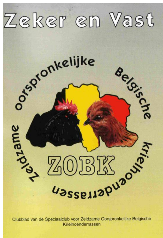
Clubblad van de ZOBK

De fokkersdag is daarnaast de gelegenheid bij uitstek om elkaar weer te ontmoeten en allerlei ervaringen uit te wisselen en samen problemen op te lossen. Verder worden op deze dag ook veel dieren uitgewisseld.