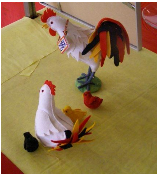
Mascottes van de ZOBK

Van deze acht rassen komt de Watermaalse baardkriel nog het meest voor, gevolgd door de Grubbe baardkriel en de Bassette. De andere vijf rassen kunnen met recht nog vaak 'uiterst' zeldzaam genoemd worden. Om misverstanden te voorkomen, de Antwerpse baardkriel behoort niet tot de ZOBK-rassen.