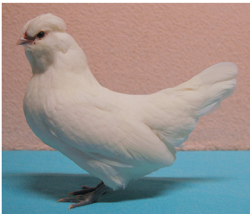
Watermaalse baardkriel hen wit

Aan de zuidoost rand van Brussel ligt de deelgemeente Watermaal-Bosvoorde. Ergens in die gemeente bevond zich aan het begin van de vorige eeuw de fokkerij 'Les Fougères' van Antoine Dresse. In deze fokkerij ontstond uit een kruising van een onbekend aantal rassen de Watermaalse baardkriel. Welke rassen hierbij zijn gebruikt is onbekend.