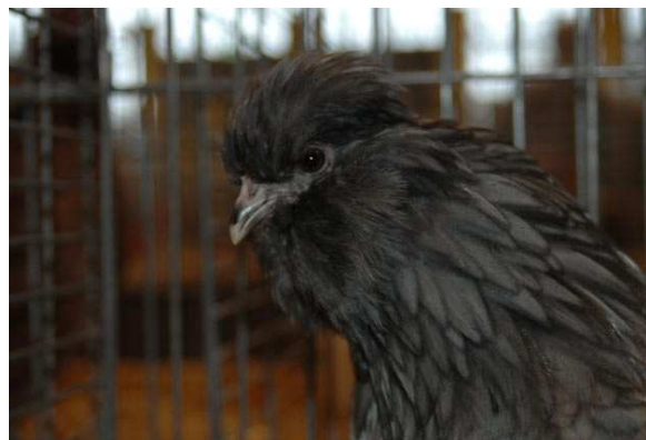
Kopstudie hen zwart