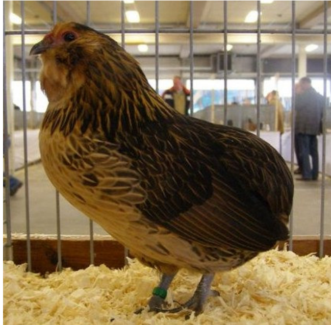
Grubbe baardkriel (kwartel)