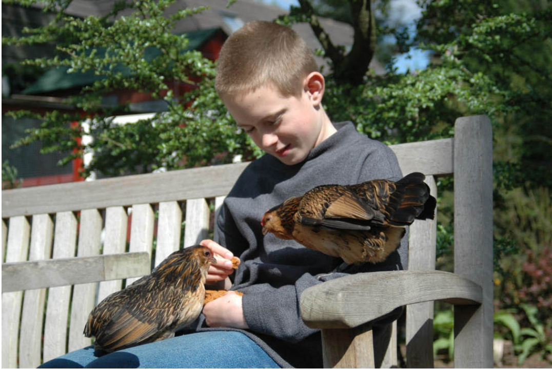
Links een Grubbe baardkriel (kwartelkleur) en rechts een Antwerpse baardkriel (kwartelkleur)