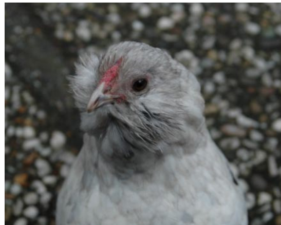
Tweemaal een fraaie kopstudie van de Grubbe baardkriel