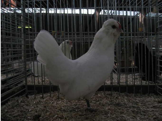
Witte Watermaalse baardkriel-hen