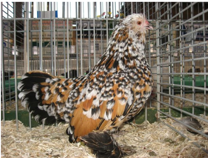
Ukkelse baardkriel-hen in porselein