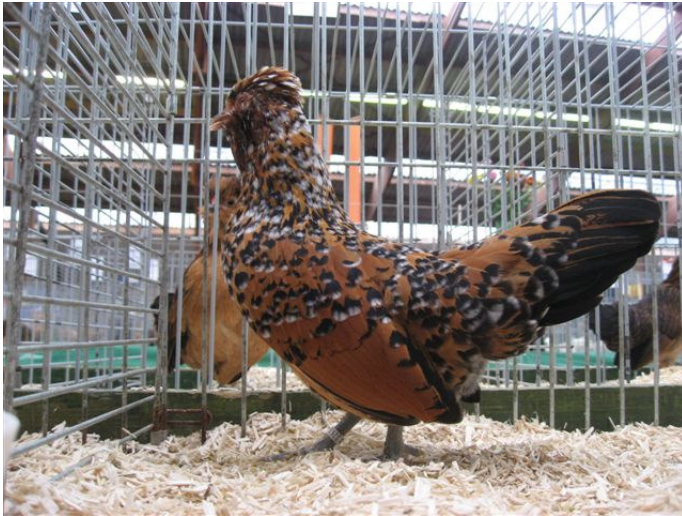
Hiernaast en onder: Watermaalse baardkriel-hennen