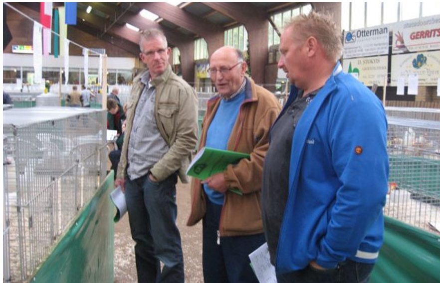
En natuurlijk wordt er uitvoerig overlegd en besproken