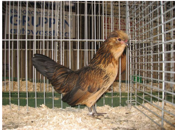
Watermaalse baardkrielen: boven kwartelkleurig en onder citroenporseleinkleurig.