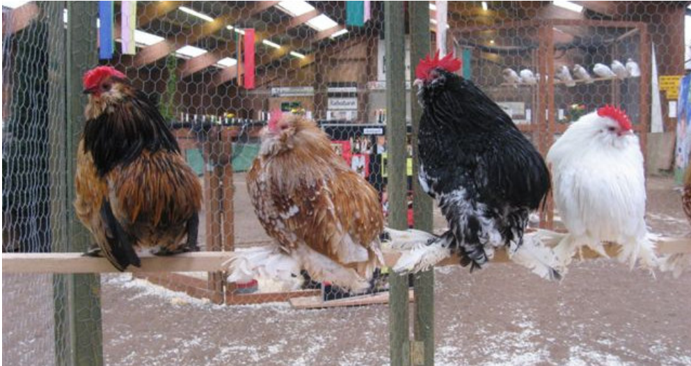
Onze bolstaarten: links een Grubbe en rechts drie Everbergse baardkrielen